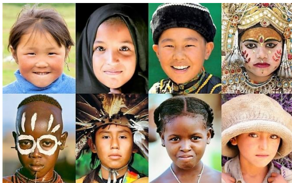
Mosaïque d'enfants, extrait. © Art Wolfe

Le concepteur et porteur du projet reliera une cinquantaine d'écoles du monde entier en se déplaçant à moto. Le point de départ de cette aventure sera le Grand Genève .